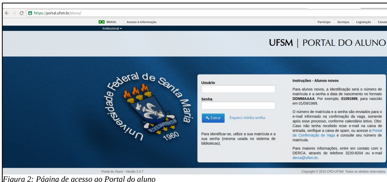
Figura 2: Página de acesso ao Portal do aluno

Na página do Portal do Aluno, informe o usuário (matrícula) e senha (a mesma utilizada, por exemplo, no sistema de bibliotecas).