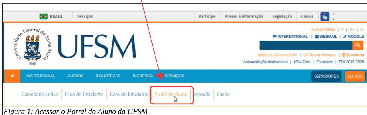
Figura 1: Acessar o Portal do Aluno da UFSM

Para acessar o Portal do Aluno acesse a página da UFSM < www.ufsm.br >, procure a caixa “Alunos” e clique em Portal do aluno .