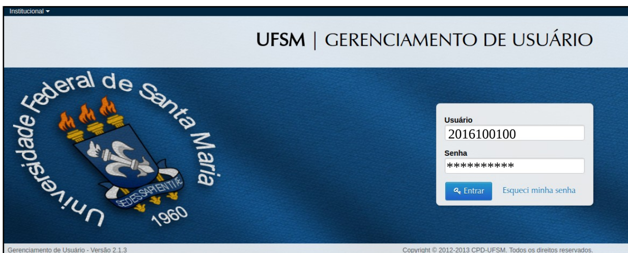
Figura 4: Página do Gerenciamento de usuário < https://portal.ufsm.br/usuario/restrita/alterarSenha.html >

3 - Na página seguinte, escreva a matrícula e a senha recebida por e-mail. Observe o exemplo da Figura 2: