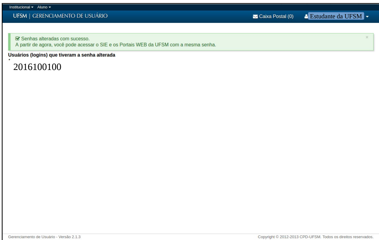
Figura 6 - Usuário é informado da alteração de senha

1 - Para testar/visualizar a senha que será utilizada para acessar o Portal do aluno e o Moodle Presencial ou UAB, escreva a senha em um editor de texto, a fim de visualizar se o que digitou no teclado é a mesma senha que é mostrada para você no editor de texto. Às vezes, ao copiar um texto, selecionamos espaços ou outros caracteres incorretos. Finalizado o processo de alteração de senha, o estudante é informado sobre quais usuários tiveram a senha alterada, conforme Figura 4.